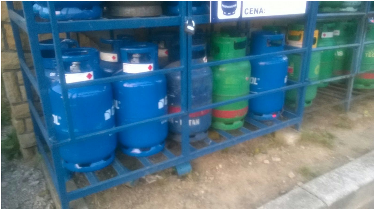
Butle z gazami (sztuki przesyłki)

Do towarów niebezpiecznych należą też ciecze i gazy, które ze względu na postać można przewozić tylko w sztukach przesyłki lub cysternami, oraz przedmioty zawierające towary niebezpieczne, na przykład zapalniczki, akumulatory, granaty, sztuczne ognie.